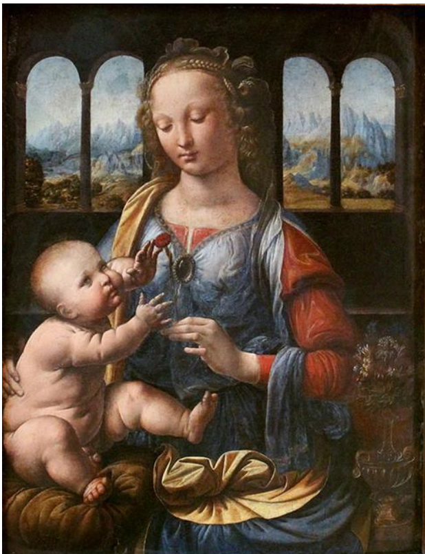
Virgem do Cravo

Entre 1482 e 1499 viveu em Milão, onde era protegido de Ludovico Aforzo, duque de Milão, para quem pintou o afresco "A Última Ceia" para o Mosteiro de Santa Maria delle Grazie. Prestou também serviços para o duque como arquiteto e engenheiro, além de pintor. Em 1503 realiza o que seria sua grande obra, Mona Lisa , utilizando a técnica de sfumato . Nesse método, o artista produz suaves dégradés nas tonalidades, o que possibilita a representação da textura da pele humana. Leonardo da Vinci foi um grande apreciador dessa forma de pintar e a utilizava muito em seus quadros. Faleceu aos 67 anos no dia 2 de maio de 1519 na França e foi enterrado no palácio de Amboise.